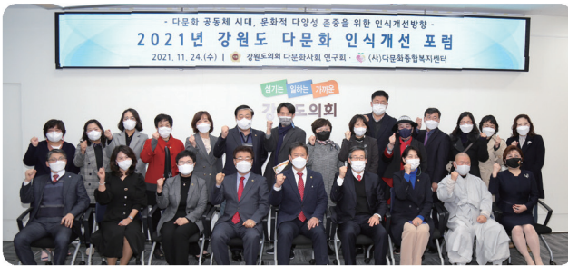
강원도 다문화 인식개선 포럼