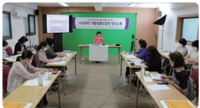
다문화인 생활법률상담원 양성교육