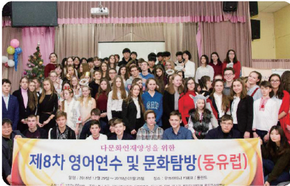
다문화 인재양성을 위한 동유럽 영어연수 및 문화탐방