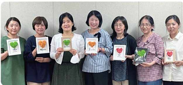
캘리그래피 전문가 양성과정