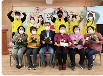
크리스탈회 어버이날 공연: "감사합니다, 어머니"