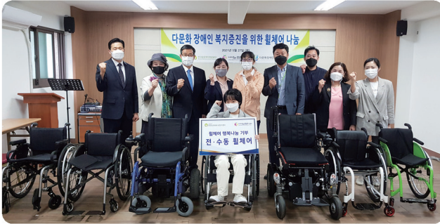
장애인가정 휠체어 전달식 (중앙보훈병원)