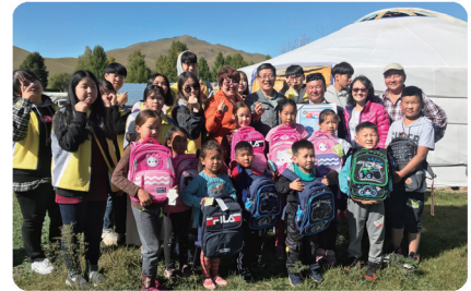
어머니나라 문화 탐방 및 봉사활동 (몽골)