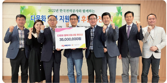
다문화가정 행복지원 사업 (한국전력공사)