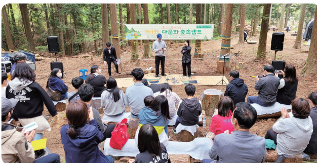
다문화 숲속캠ป์ (여수지부)