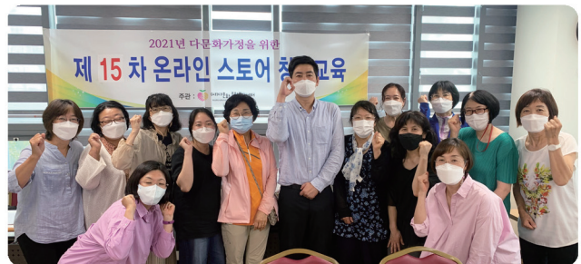
온라인 스토어 창업교육