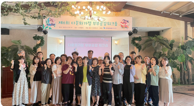
다문화가정 부부공감워크숍 (한국증권금융 꿈나눔재단)