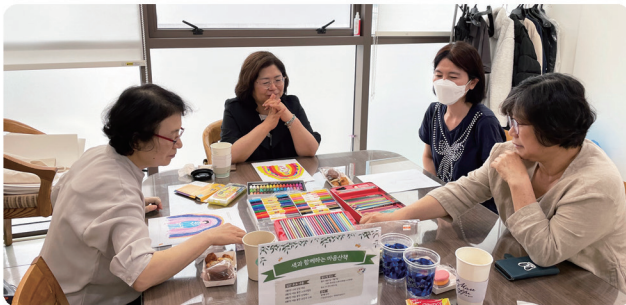
장애 아동 부모 심리치료: 색과 함께하는 마음산책