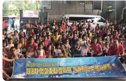
어머니나라 문화 탐방 및 봉사활동 (필리핀)