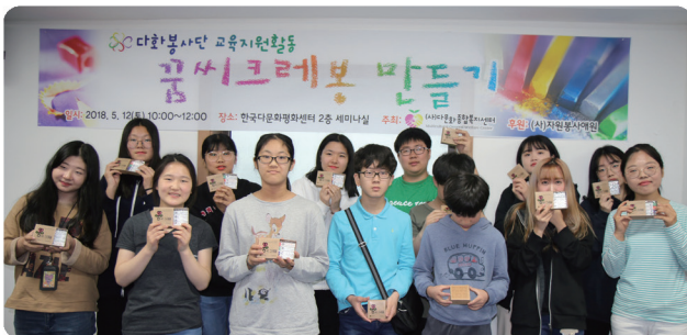
다화봉사단 품씨크레봉 만들기