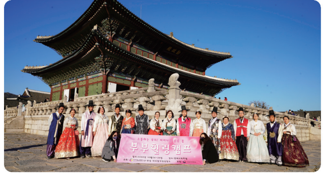
가정폭력 가해자 교정치료 프로그램 (여성가족부)