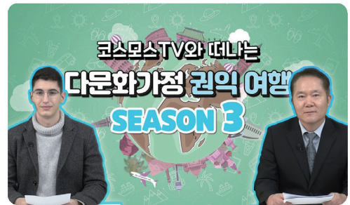
유튜브 채널: 코스모스 TV