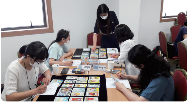
이주여성 힐링 프로젝트