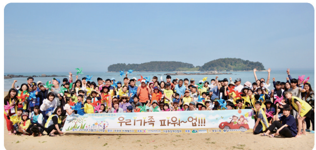
다문화 장애인 가족캠프 우리 가족 파워~업!!! (무창포)