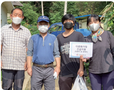
다문화가정 긴급 의료지원