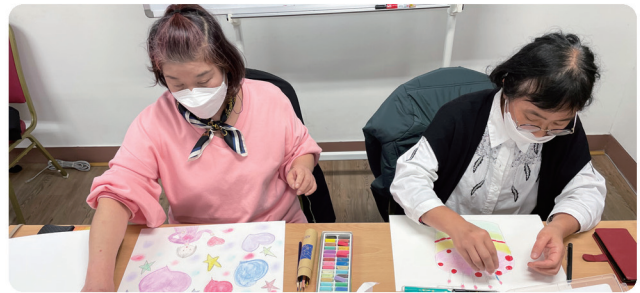
색으로 떠나는 심리상담 서포터 양성교육(행정안전부)