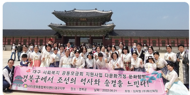
다문화가정 경북궁 문화탐방 (대구지부)