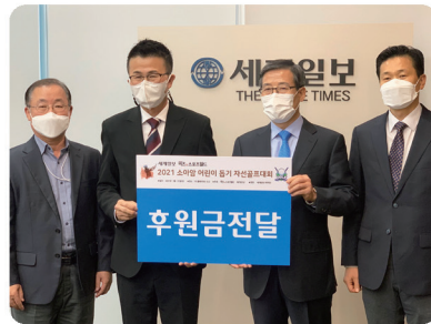
다문화가정 소아암 아동 치료비 후원금 전달식